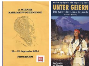
Wien und Bad Segeberg