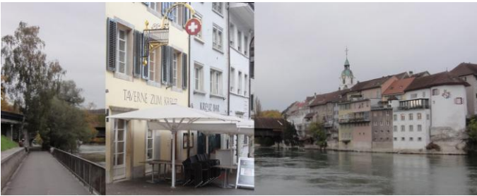
Taverne Restaurant Kreuz in Olten

Die Zusammenkunft einiger Besucher von verschiedenen KM-Veranstaltungen wurde mittlerweile zu einer Tradition. Olten eignet sich gut dazu. Dieses Jahr erinnerten wir uns an Bad Segeberg, Lugano, Radebeul, dem 3. Treffen in Wien, KM-Filmplakate in Utzigen, Freiburg i.Br. und Referat in Vitznau